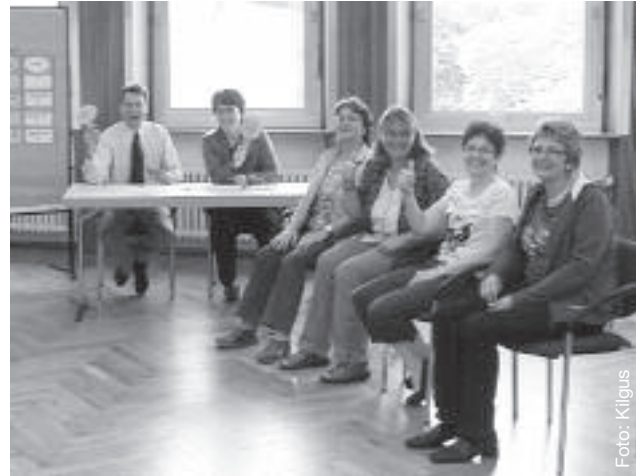
Die Landesleitung der Sozialarbeit als „Jury“ bei der Motivations-Game-show.

Erstmals hat am 7. und 8. Juni an der Landesschule ein Grundlagenmodul „Leiten und Führen von Gruppen“ für Kreissozialleiterinnen stattgefunden. Die Sozialarbeit im DRK-Landesverband Baden-Württemberg e.V. umfasst ein gewaltiges Spektrum an Aufgaben, wie Jugendhilfe, Familienarbeit und Familienbildung, Programme für Migranten, Gesundheitsförderung, ambulante soziale und sozialpflegerische Dienste, Alten- und Behindertenarbeit. In den vielen Fachbereichen sind tausende ehrenamtliche Mitarbeiterinnen und Mitarbeiter engagiert. Für die Leitung dieser ehrenamtlichen Aufgaben sind auf Kreisverbandsebene die Kreissozialleiterinnen und -leiter, in den Ortsvereinen die Sozialleiterinnen und -leiter und Leiterinnen und Leiter von Arbeitsgemeinschaften zuständig. Während es für Fachkräfte in der Sozialarbeit eine Vielzahl an Qualifizierungsangeboten gibt, bestehen für diese verantwortliche Leitungsfunktion in der Sozialen Arbeit keine entsprechenden Qualifizierungsange-