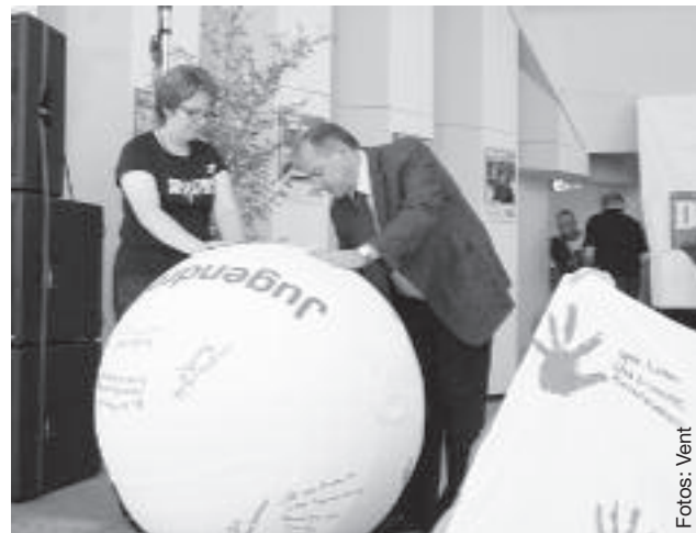
Auch Josip Juratovic, MdB, schrieb einen Wunsch auf den Ball.

für die Kinder und Jugendlichen auf die Säule. An einer Bastelstation konnten die LAGA-Besucher Anti-Stressbälle aus Kampagnenluftballons herstellen. Auf einer Leinwand hinterließen Kinder ihre farbigen Handabdrücke und schrieben dazu, was sie sich für ihre Zukunft wünschen.