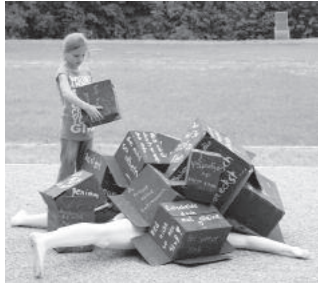
Was Kinder erdrückt, stand auf den „Stolpersteinen“ geschrieben.

Nach dem Bühnenstart am Morgen ließen JRK'ler logo-bedruckte Riesensäule durch das Landesgartenschau Gelände rollen. Die Besucher schrieben ihre Wünsche