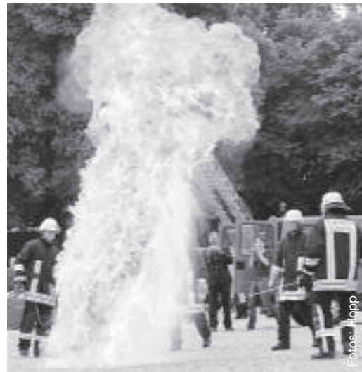
Spektakel beim „Tag der Sicherheit“.

Brummer mit seinem Referat über das Management eines hochinfektiösen Patienten.