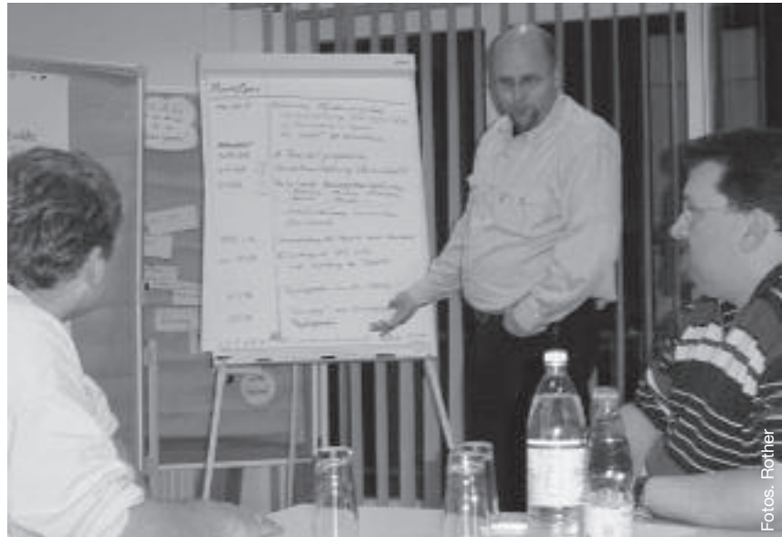
Das Modul „Grundlagen des Personalmanagements“ umfasst 16 Unterrichtseinheiten.

Nun folgt die Bedarfsanalyse: Für welche Aufgaben brauchen wir welche Kompetenzen? (Hierzu hat sich sehr bewährt Aufgabenprofile anzufertigen.) Bestimmung der Ziel-