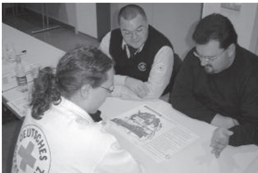
Leitungs- und Führungskräfte werden für Personalmanagement ausgebildet.

Hat eine bisherige Leitungskraft ihr Amt niedergelegt, überlegt man ad hoc über die Nachfolge. Mit dem