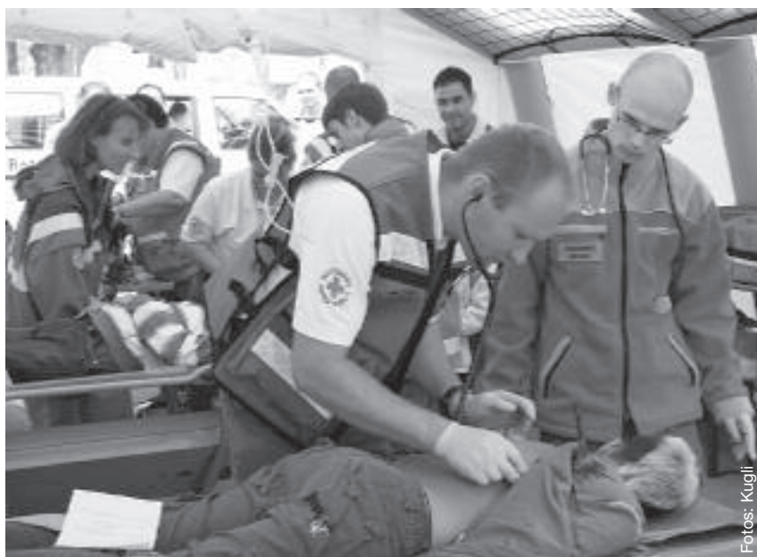
In einer Demonstration am Behandlungsplatz wurden Verletzte versorgt.