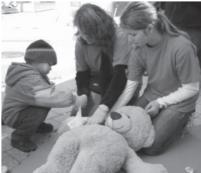
Im Bärenhospital konnten die kleinen Besucher Erste Hilfe leisten.