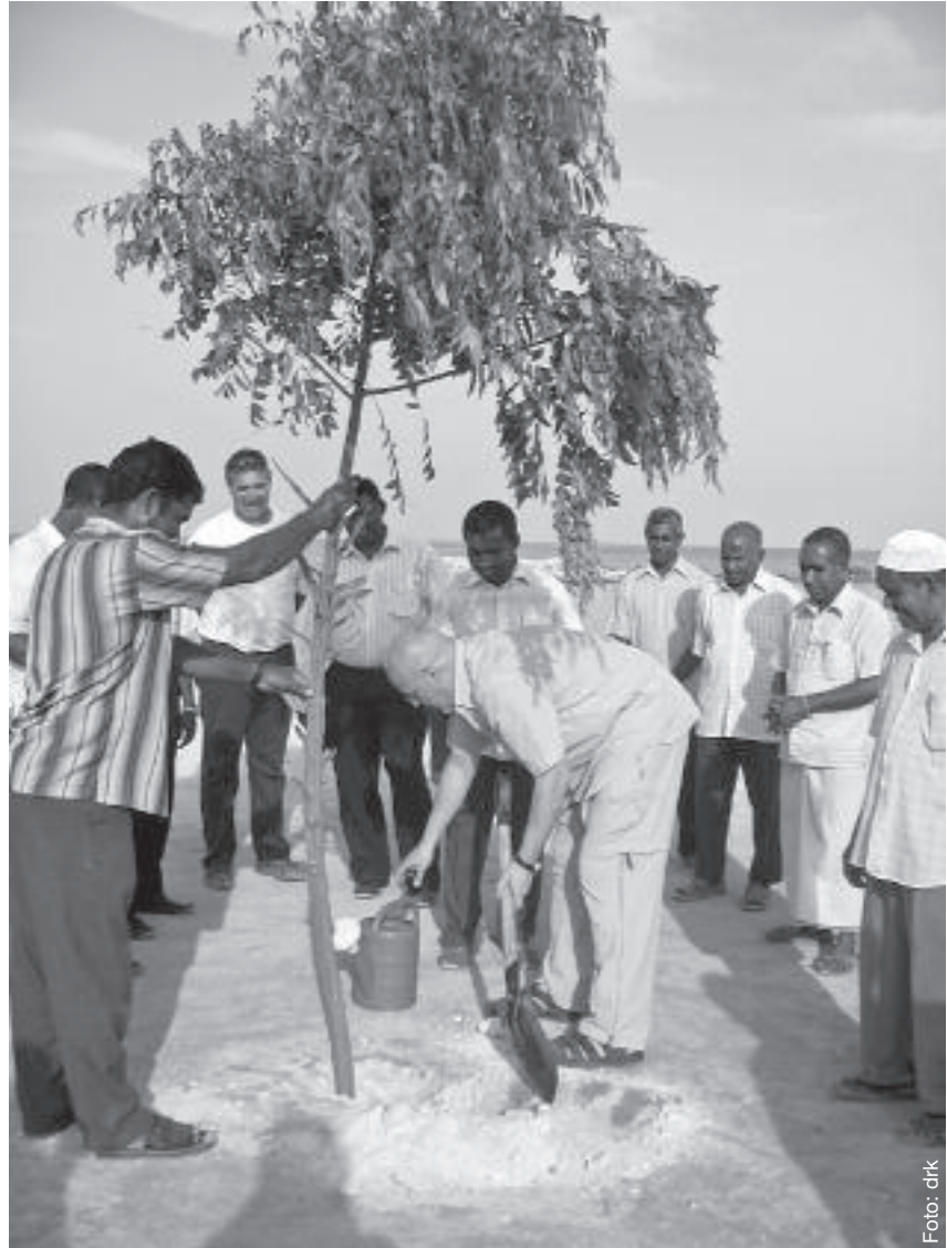
Ein Symbol für den Wiederaufbau: Bäume pflanzen auf Sri Lanka.

Direkt nach dem Tsunami waren in den sieben betroffenen Ländern weit mehr als 100.000 freiwillige Rotkreuzhelfer im Einsatz, die sich um Verletzte kümmerten. Sie verteilten Trinkwasser, Lebensmittel und andere Hilfsgüter. Stunden nach der Katastrophe waren bereits erste Experten des Internationalen Roten Kreuzes in der Region, um das Ausmaß der Schäden und den Hilfebedarf abzuschätzen. Das Deutsche Rote Kreuz schickte Wasseraufbereitungsanlagen, Gesundheitsstationen, ein mobiles Krankenhaus und Experten in die Region, um die hygienische und