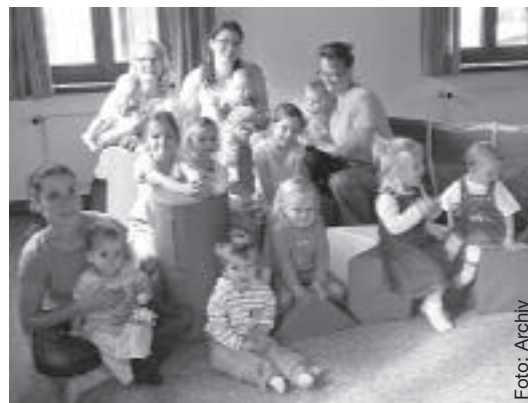
Spiel- und Kontaktgruppen unterstützen Eltern und geben Hilfen in der Kindererziehung.

Damit soll bis Ende 2013 das Ziel erreicht werden, für jedes dritte Kind unter drei Jahren einen Betreuungsplatz anbieten zu können. Die Ministerin betonte: „Gerade in wirtschaftlich schwierigen Zeiten ist es wichtig weiterhin konsequent in eine hochwertige Bildung und Betreuung von Kindern und Jugendlichen zu investieren.“ rka