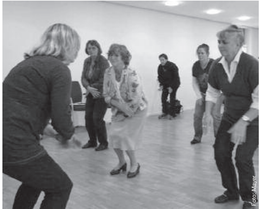
Das Erlernen rhythmischer Bewegungen ist ein Teil des Jugendbegleiterprogrammes.

Das Rote Kreuz trägt das Konzept „Jugendbegleiter“ der Landesregierung mit. Die ersten Verträge zwischen Kreisverbänden und Schulen, in erster Linie mit Angeboten des Jugendrotkreuzes und der Bereitschaften, waren schnell geschlossen. Der Schulsanitätsdienst