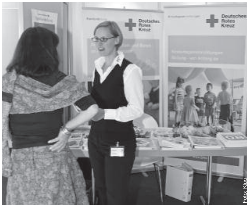
Das Rote Kreuz präsentierte seine Angebote in der Jugend- und Familienbildung im Haus der Wirtschaft in Stuttgart.

Das Land Baden-Württemberg unterstützte den Kongress im Rahmen der Initiative Kinderland Baden-Württemberg. Ministerpräsident Günther H. Oettinger übernahm die Schirmherrschaft und das Ministerium für Arbeit und Soziales sowie das Wirtschaftsministerium förderten den Kongress.